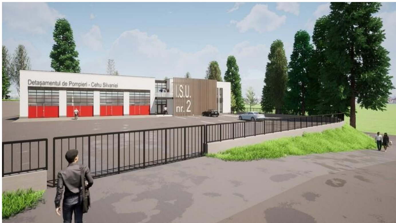
Figura 7 Noua clădire propusă

În plus, clădirea va corespunde celor mai noi cerințe de eficiență energetică și va fi dotată pentru a asigura standarde înalte pentru personalul GICS și pentru pompierii și personalul SMURD care își desfășoară activitatea în clădire.