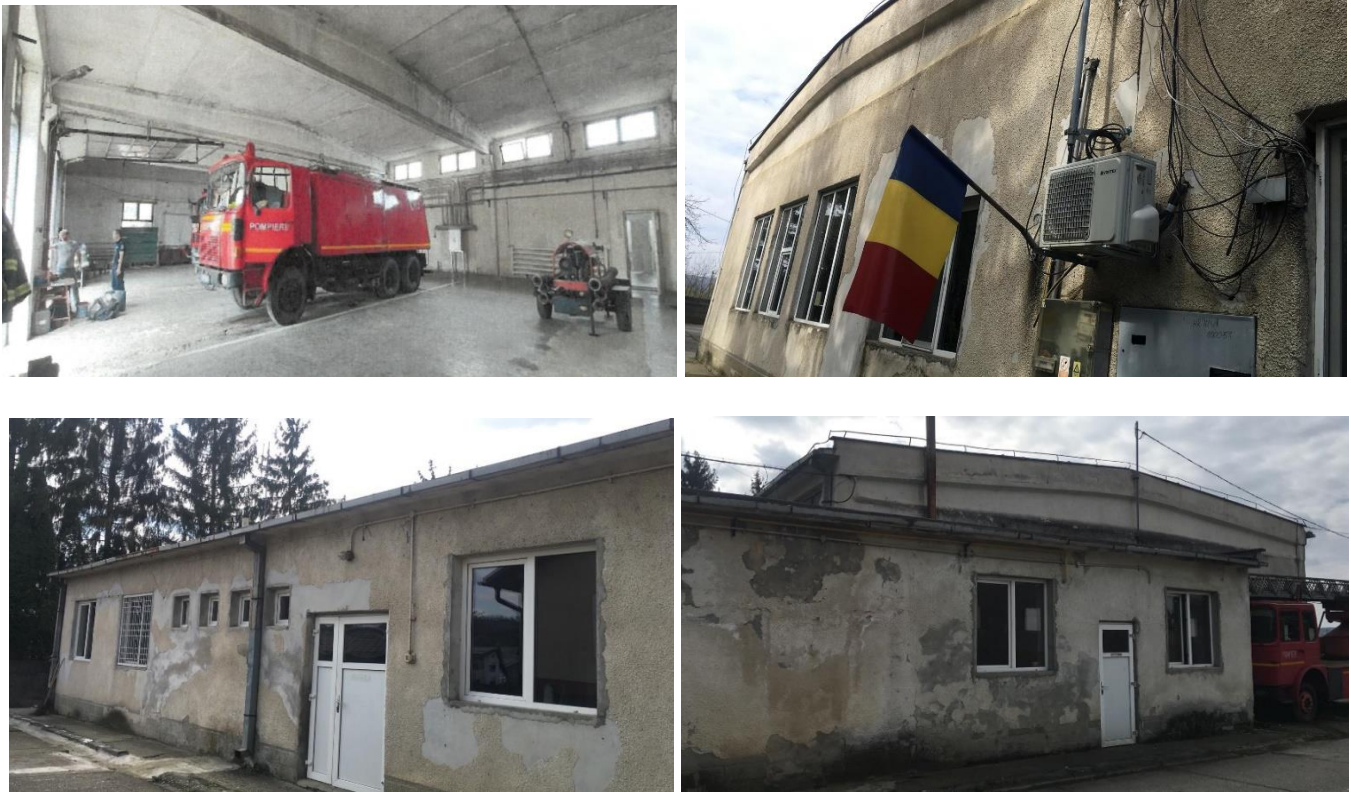
Figura 6 Clădirea administrativă C1 a GICS și garajul

În urma unei expertize efectuate de un expert tehnic autorizat, clădirea a fost clasificată în clasa I de risc seismic, care include clădirile cu un risc ridicat de prăbușire sub efectul cutremurului de proiectare. O nouă clădire va fi construită pe aceeași parcelă de teren.