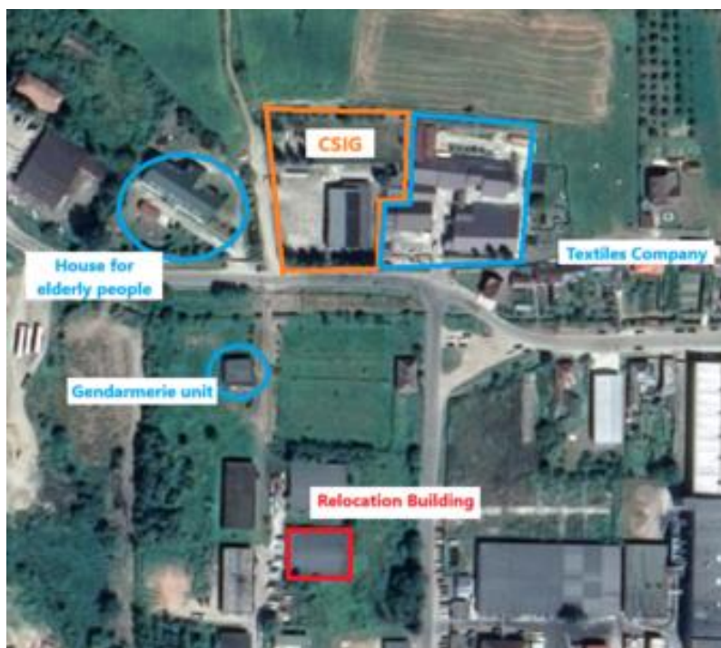
Figura 5 Principalele vecinătăți ale GICS

Terenul este situat la marginea vestică a zonei rezidențiale a orașului, lângă o fostă zonă industrială, și este mărginit la nord de terenuri private, la est de facilități de producție, birouri, ateliere și depozite ale unei companii de textile, la sud de strada Dozsa Gyorgy și o unitate a Jandarmeriei, iar la vest de un drum local și o clădire în care funcționează o casă pentru persoane în vârstă și o asociație pentru îngrijirea persoanelor cu sindrom Down.