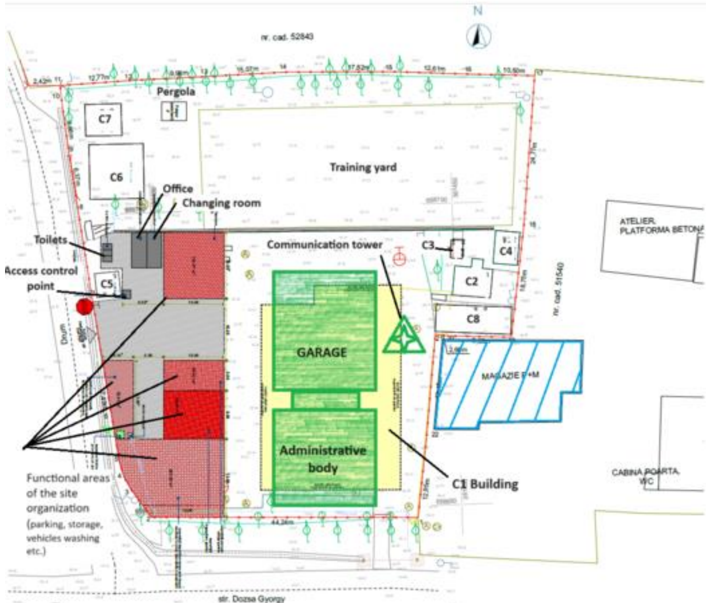
Figura 3 Clădirile existente și poziționarea propusă a noii clădiri; schița organizării de șantier

Zona din partea de nord a parcelei de teren - unde se află curtea de antrenament și alte trei construcții mici - va fi împrejmuită și nu va fi utilizată pentru activitățile de construcție.