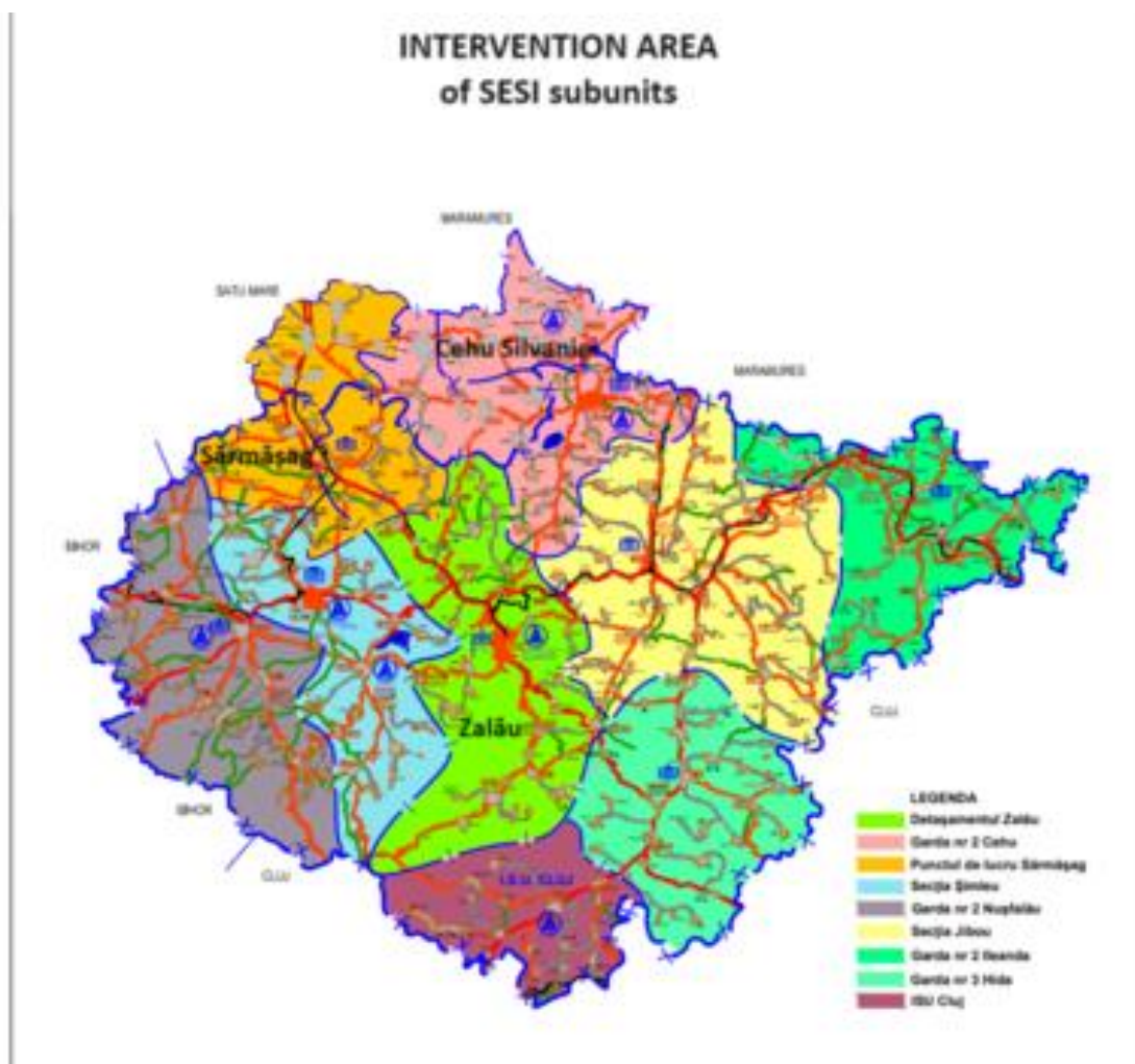
Figura 4 Harta județului Sălaj Zona de intervenție a GICS este marcată cu verde

Activitatea Gărzii nr. 2 Cehu Silvaniei constă în principal în intervenții în situații de urgență; în prezent unitatea acoperă intervenții în zona de nord a județului Sălaj, dar și în partea de sud a județelor Maramureș și Satu Mare pe o suprafață de 424, 41 km pătrați cuprinzând un oraș, 8 comune și 34 de sate cu un total de 22.181 locuitori.